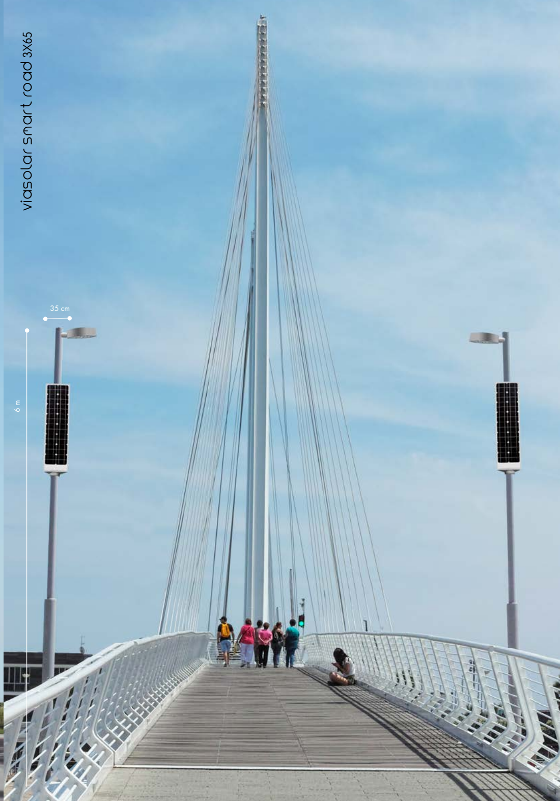
viasolar smart road 3X65