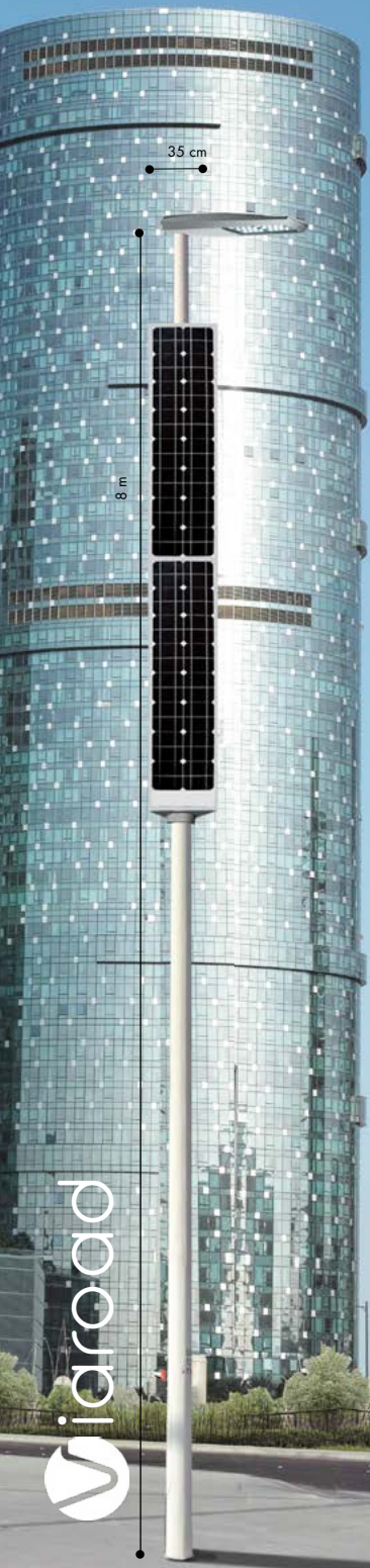
viasolar road 6X65